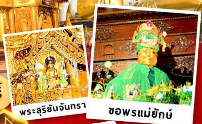
พระสุริยันจันทร